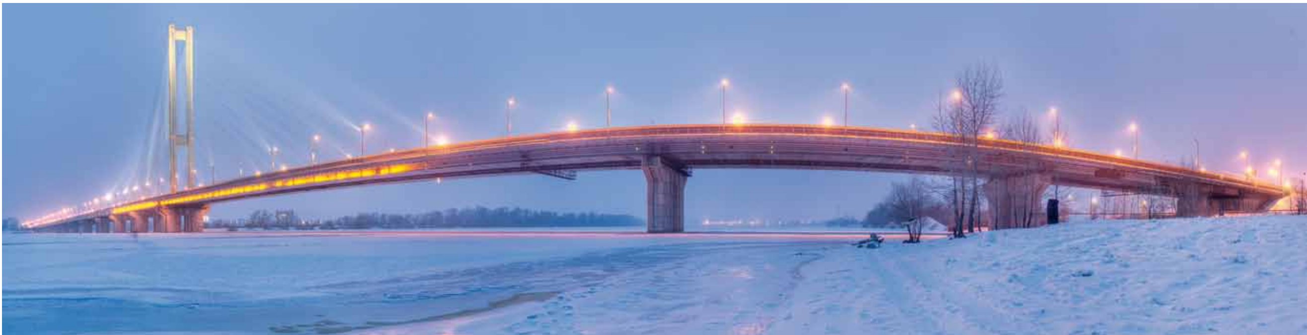
Южный мостовой переход через Днепр (вверху) – самый молодой в Киеве. Строительные работы по его возведению были окончены в 1990 году, поезда метро пущены в 1992-м. Главные пролеты Южного моста формируют причудливый силуэт арфы. Русановский мост (внизу) – продолжение моста Метро, длина его 350 метров.