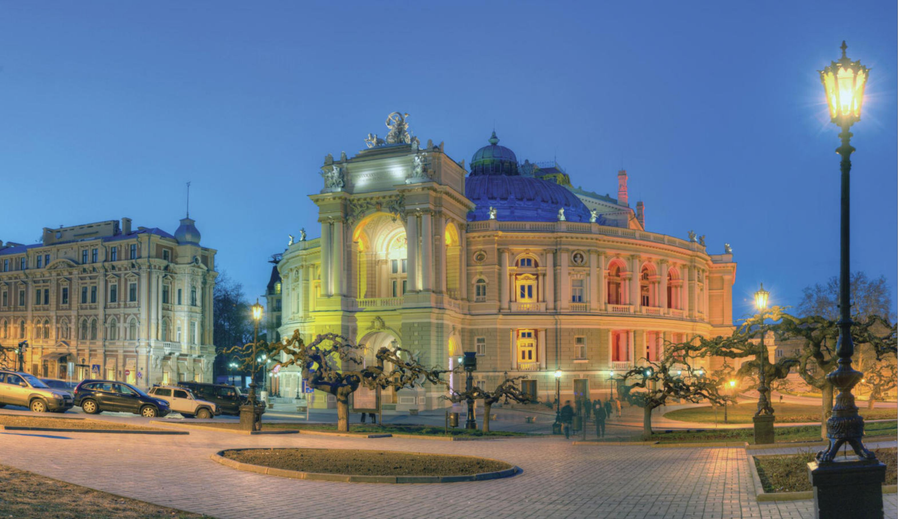
Одеса, оперний театр