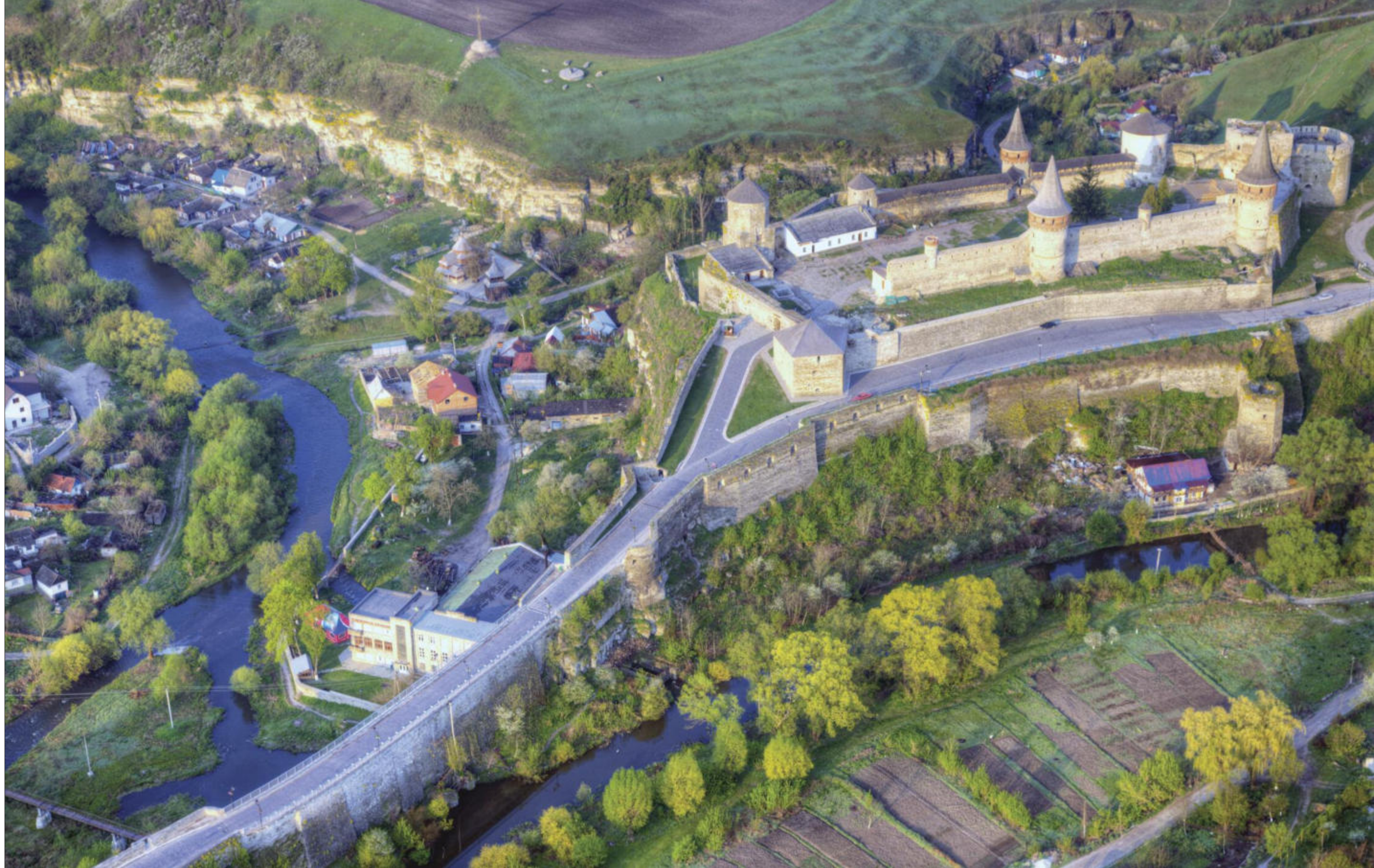
Kamyanets-Podilskyi, Old Fortress