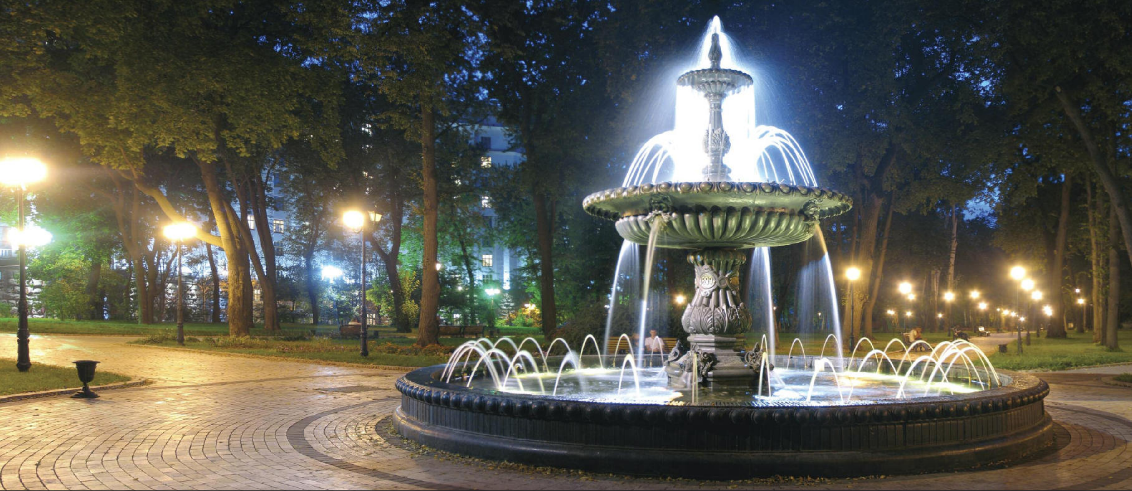
Київ, фонтан в Міському саду Kyiv, fountain in the City Garden