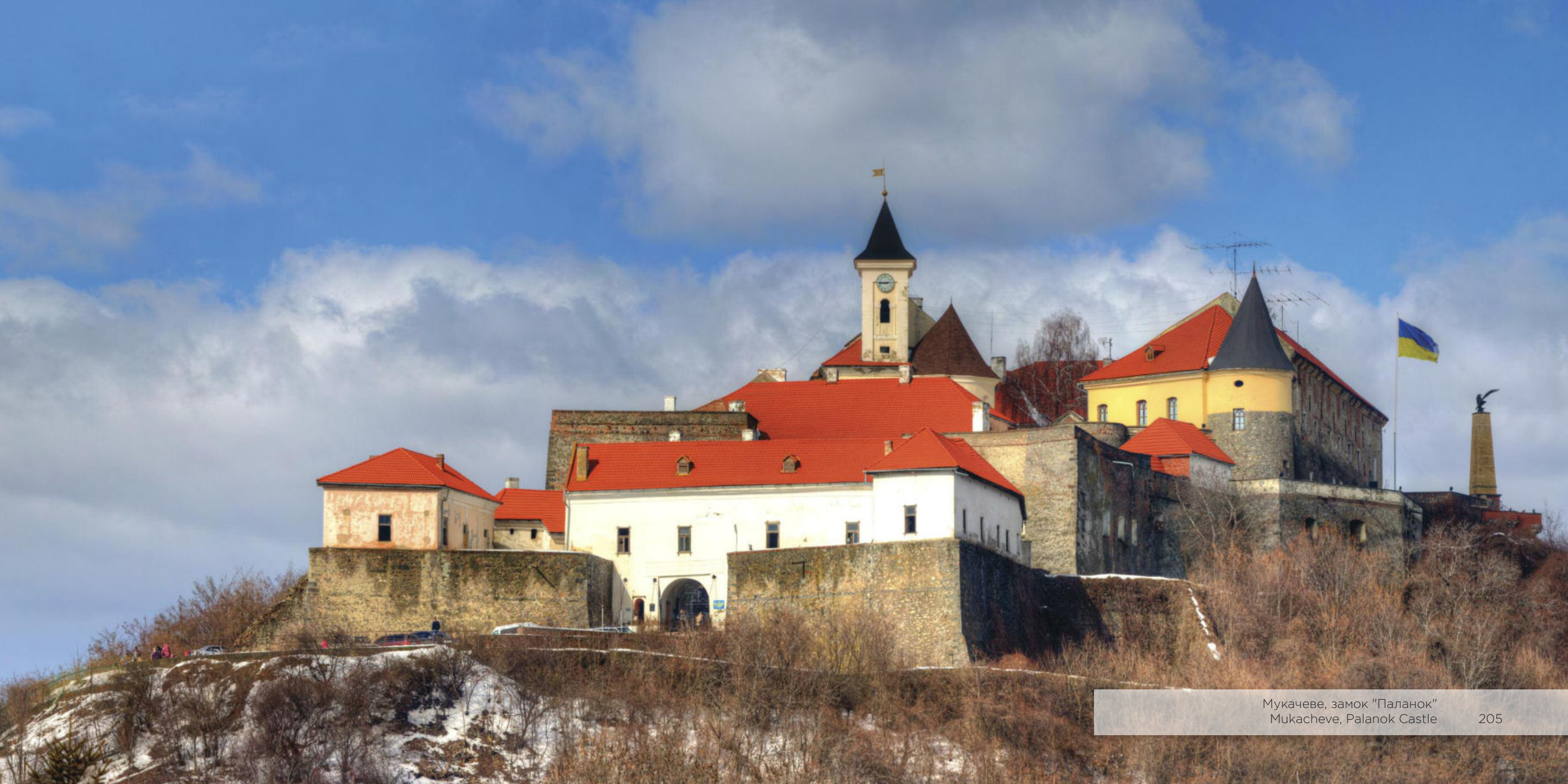
Мукачеве, замок "Паланок" Mukacheve, Palanok Castle