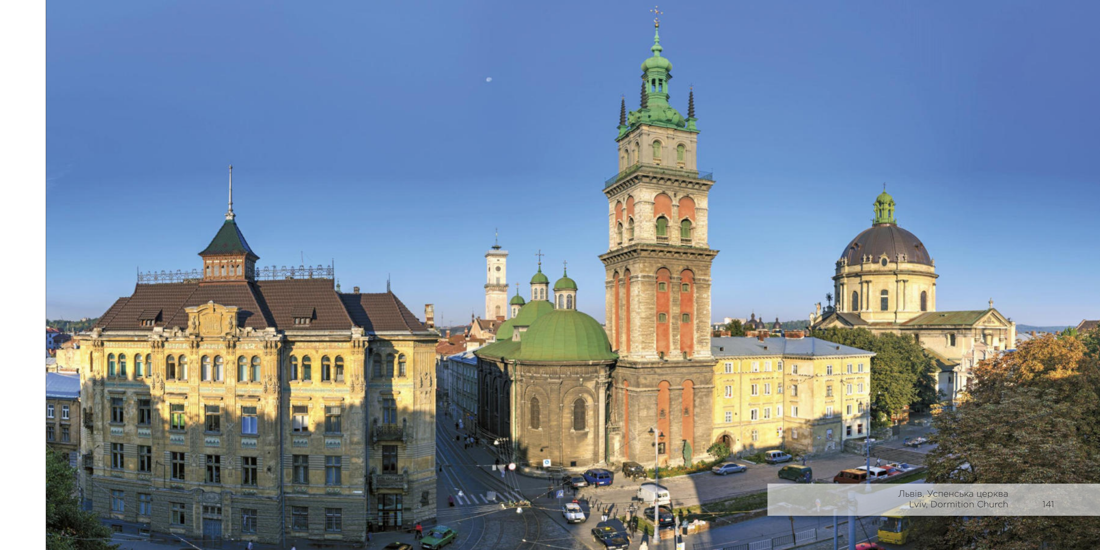
Львів, Успенська церква Lviv, Dormition Church