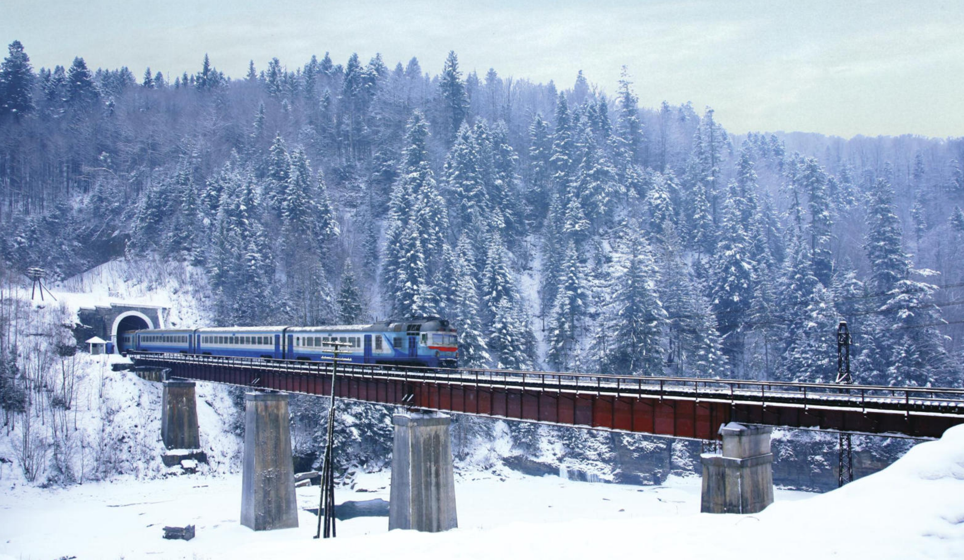
Яремче, міст через р. Прут