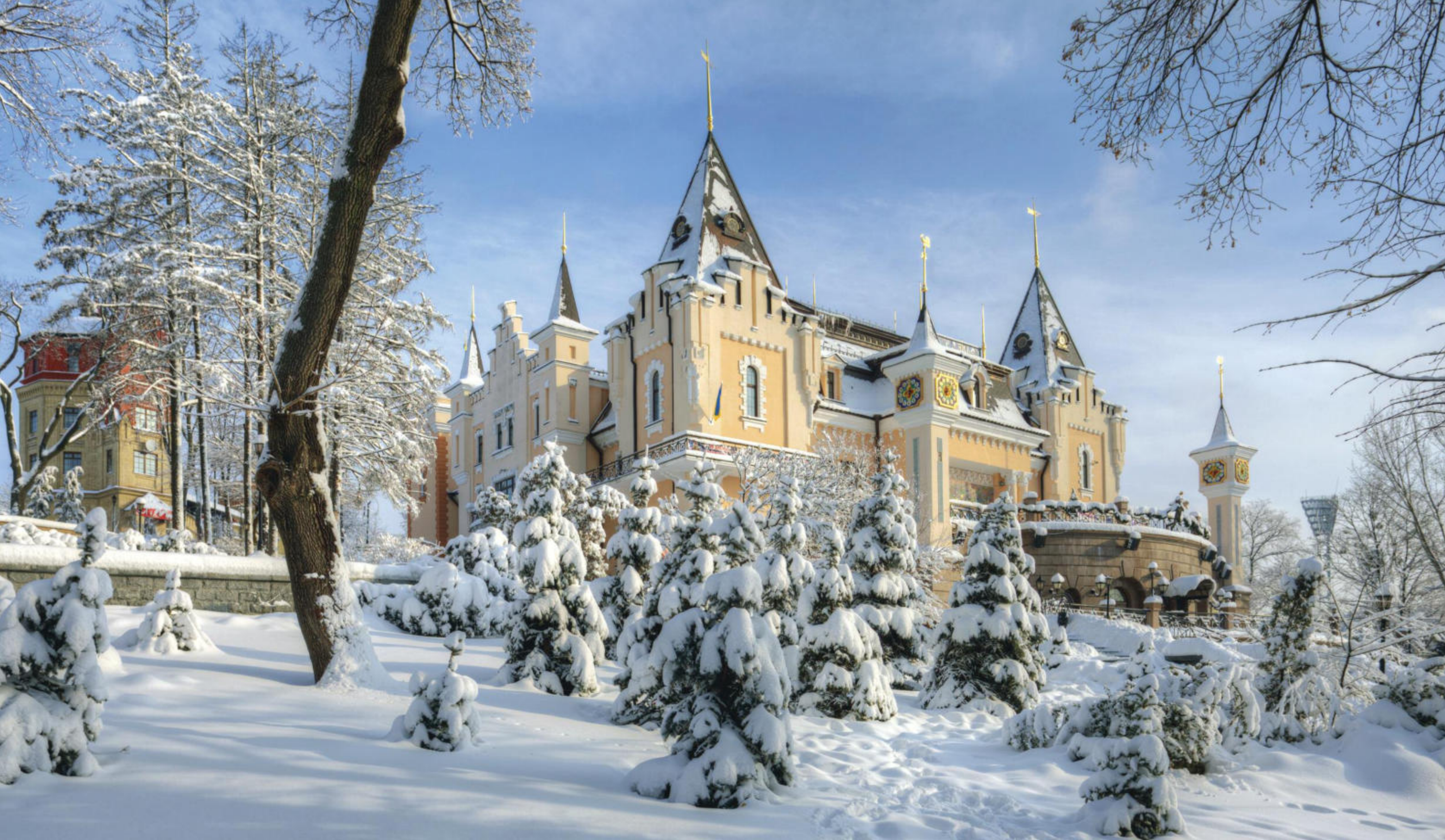
Київ, академічний театр ляльок