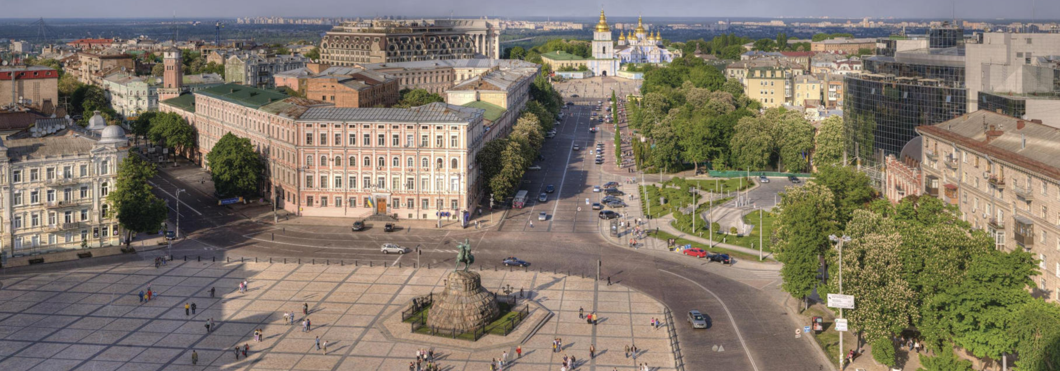
Київ, краєвид з дзвіниці Софії Київської Kyiv, View from Sophiya Kyivska Bell Tower