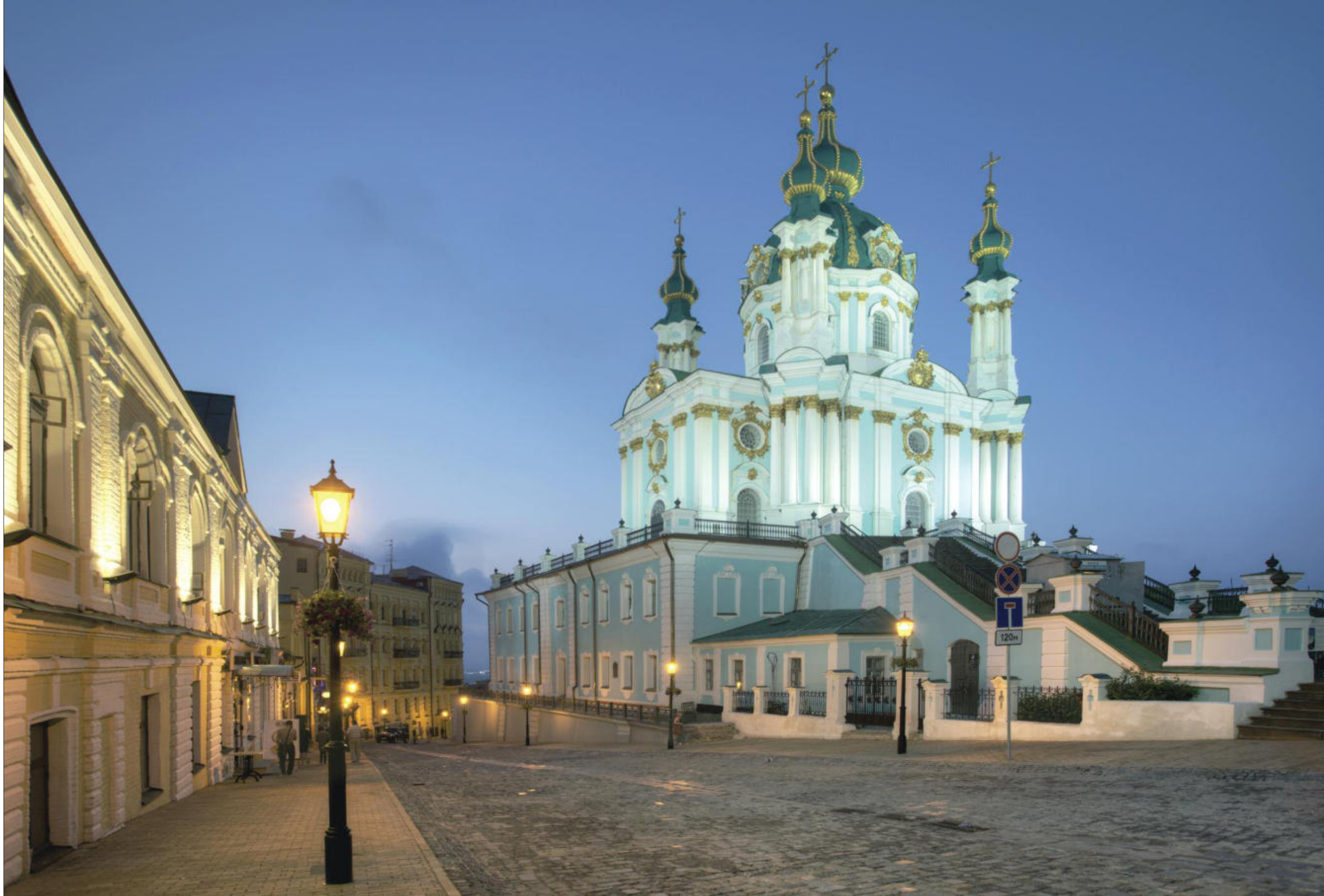
Київ, Андріївська церква Kyiv, Andriivska Church