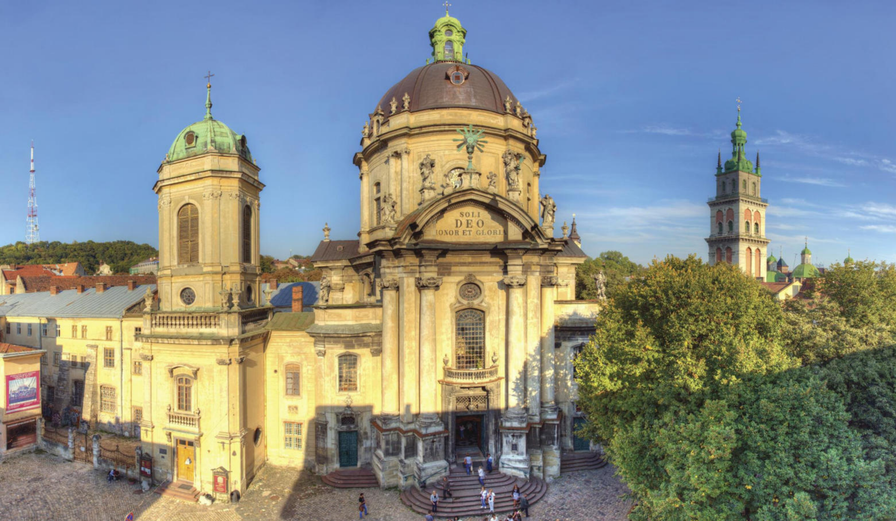
Львів, монастир домініканців