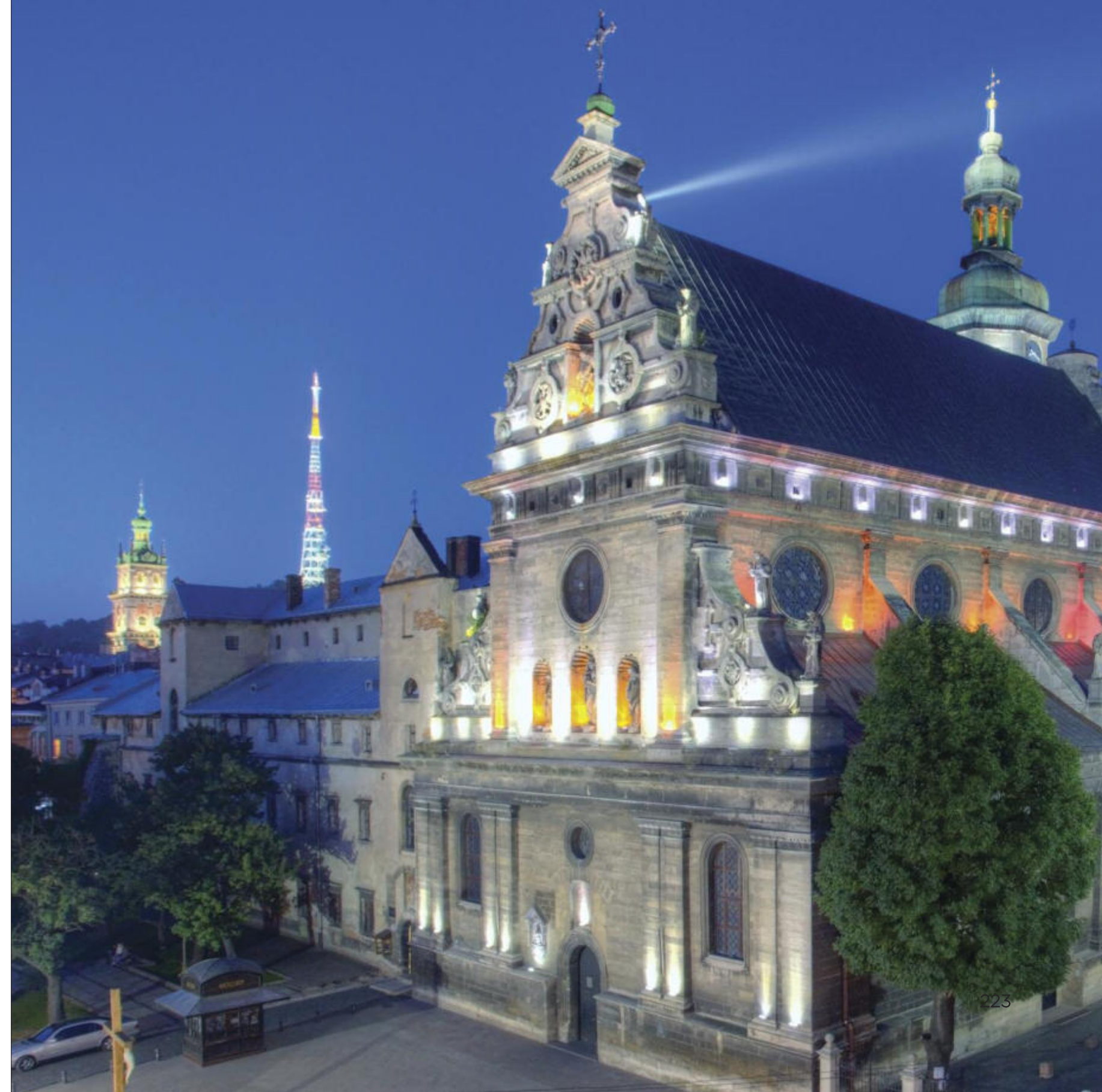
Львів, монастир бернардинців Lviv, Bernardine Monastery