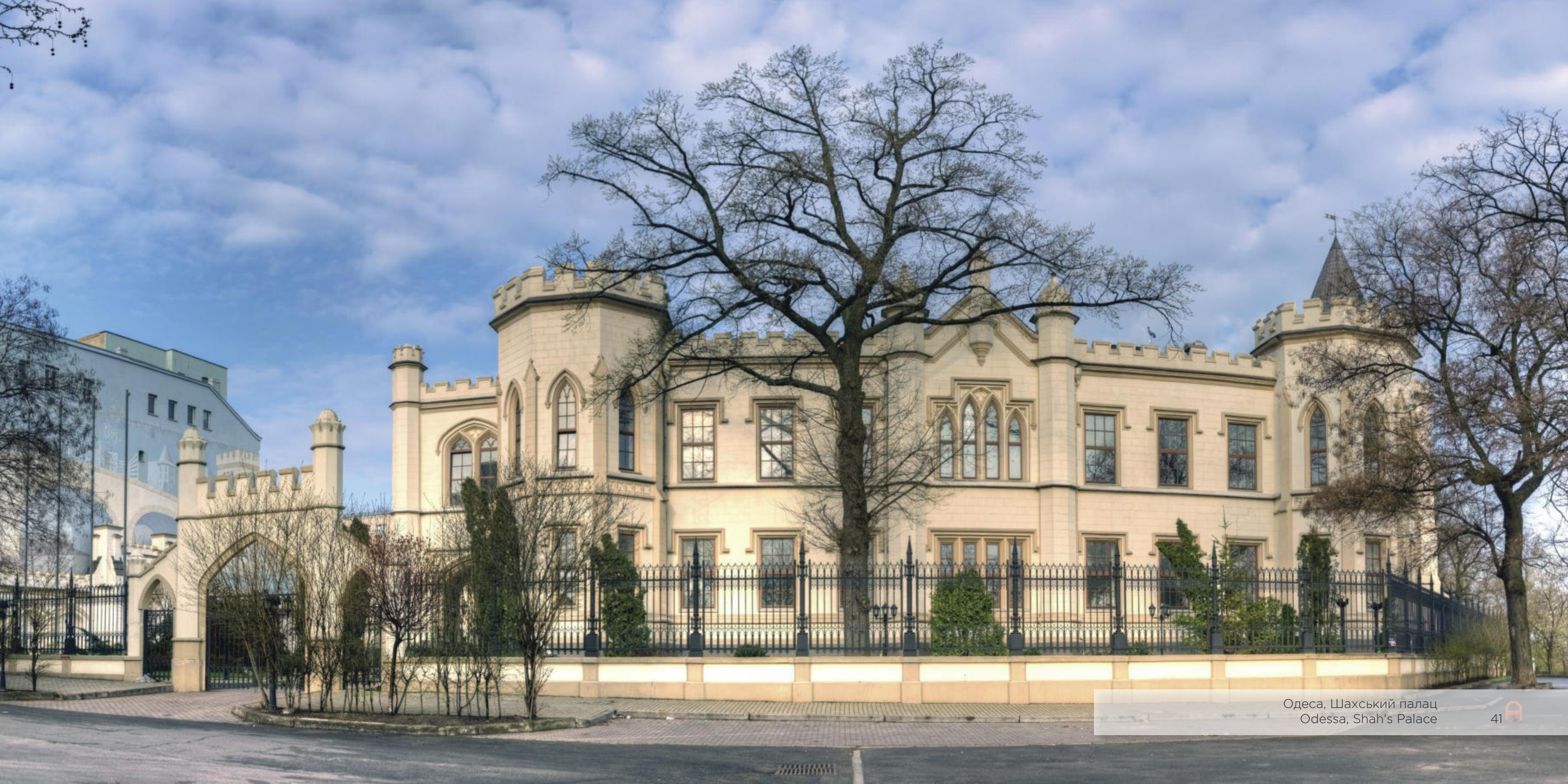
Одеса, Шахський палац Odessa, Shah's Palace