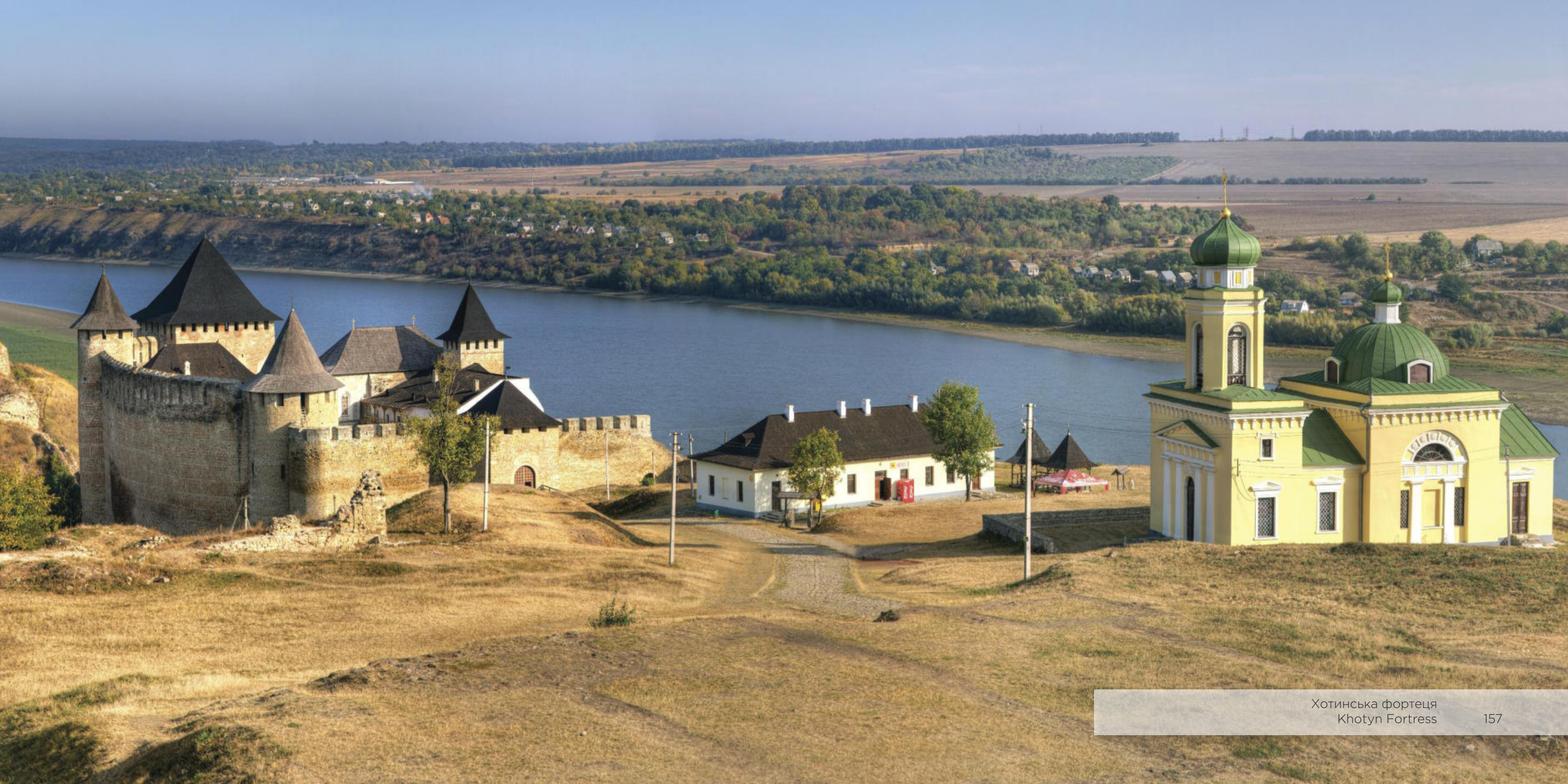
Хотинська фортеця Khotyn Fortress