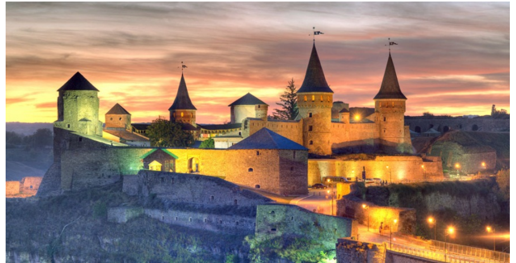
Мои фотографии, отмеченные призом